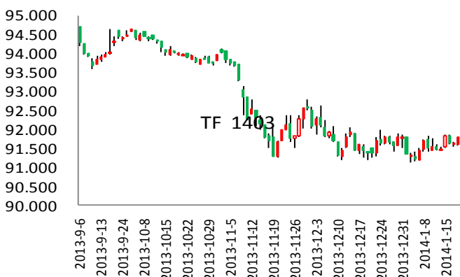
图表2: TF1403与TF406日K线图 (单位: 元)