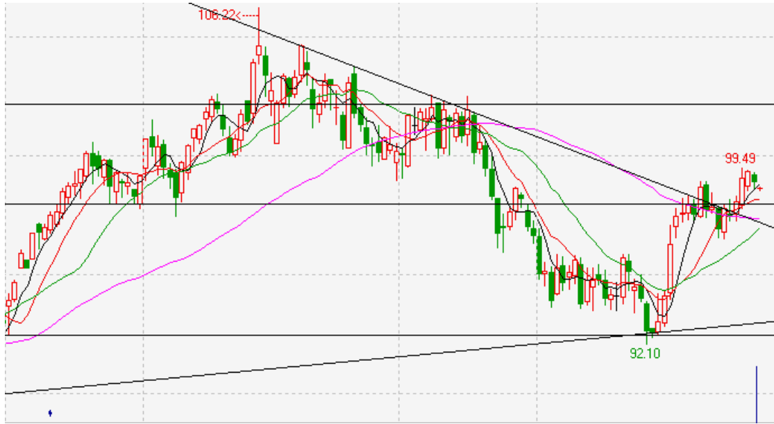
图 1： NYMEX（纽约商业交易所）WTI（西德克萨斯低硫轻质原油）原油期货 1402 合约走势图

截止 9.17 日，CFTC 公布的数据显示，原油非商业多头持仓 2400 手，较上周增加 298 手，增幅为 14.18；原油非商业空头持仓为 3470 手，较上周增加 1298 手。原油持仓净空 1070 手，市场看空氛围较重。